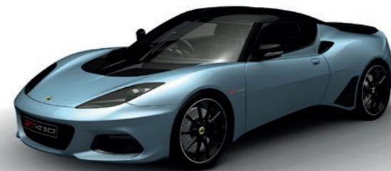
HELLBLAU METALLIC C208