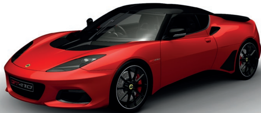
ROT SOLIDE C183