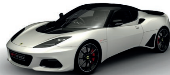
WEISS METALLIC C201