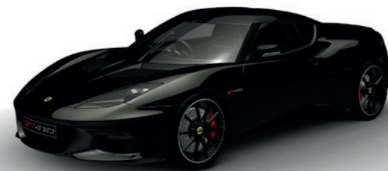
SCHWARZ METALLIC C186