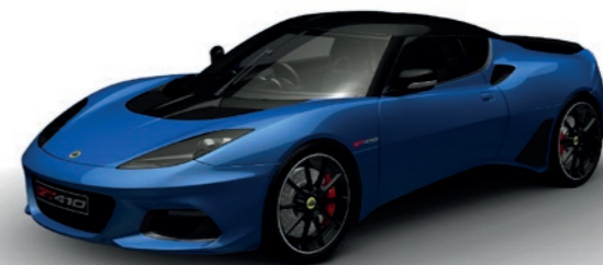
BLAU METALLIC C202