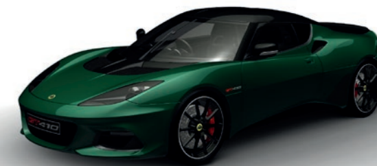
RACING GREEN METALLIC C203