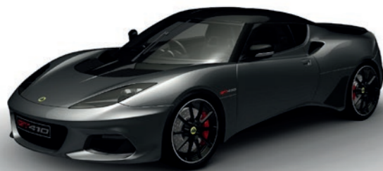
GRAU METALLIC C185