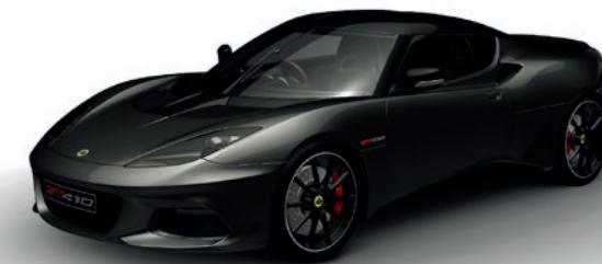
DUNKELGRAU METALLIC C213