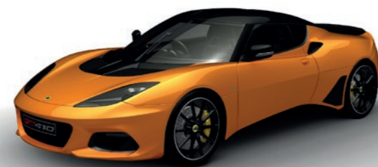
ORANGE MÉTALLISÉE C205