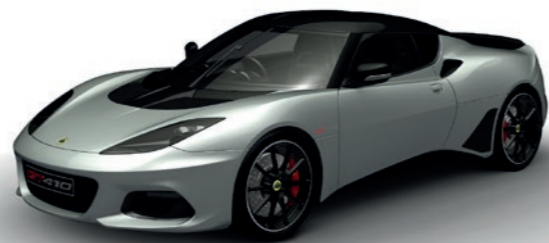
ARGENT MÉTALLISÉE C190