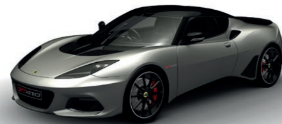
EVORA ARGENT MÉTALLISÉE C180

Les images sont à titre de comparaison seulement. Veuillez contacter votre revendeur pour obtenir des échantillons de couleurs plus précis.