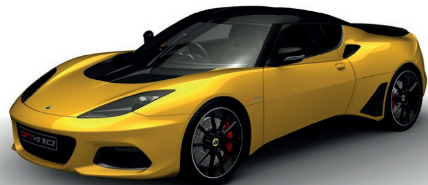
JAUNE SOLIDE C206